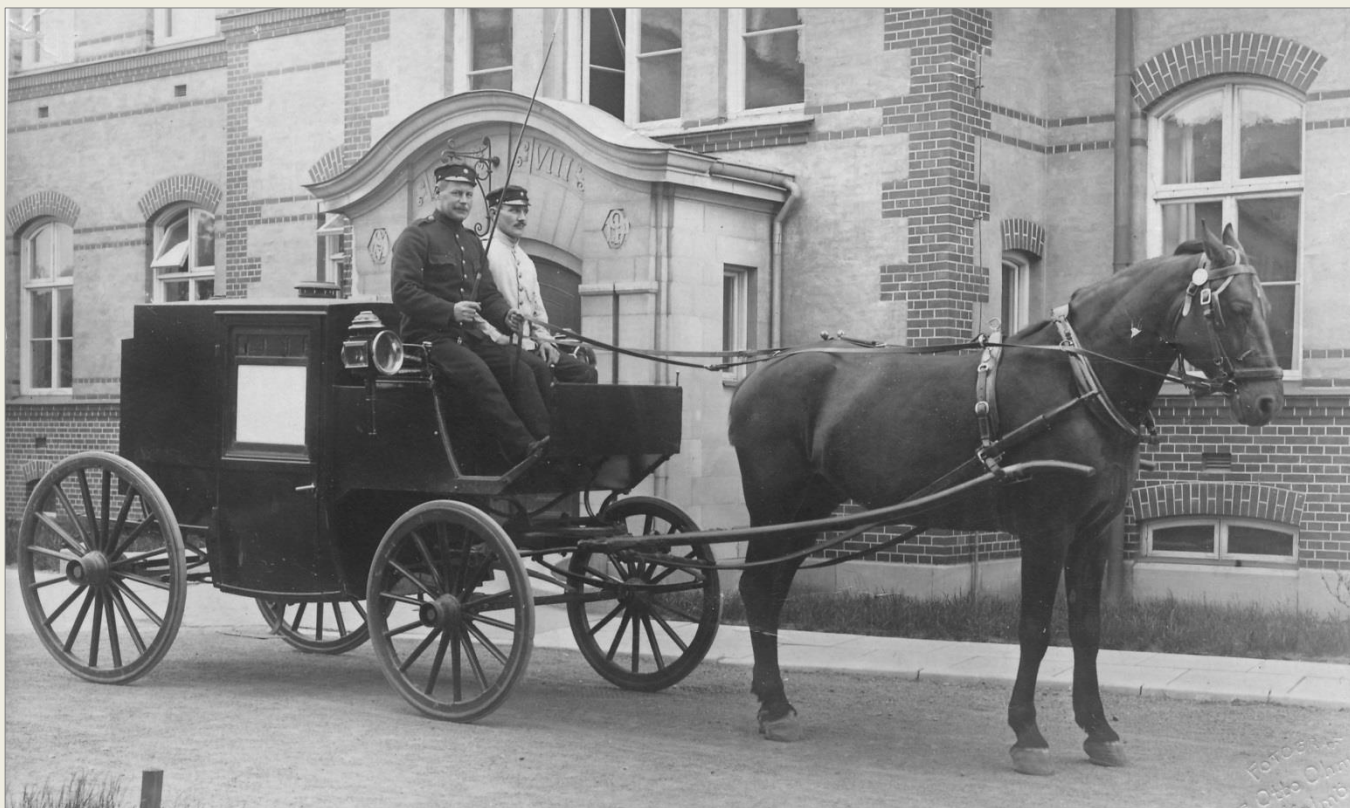
Den svarta sjuktransportvagn kom till Brandkåren 1903. Den kördes på uppdrag av Malmö Hälsovårdsnämnd.