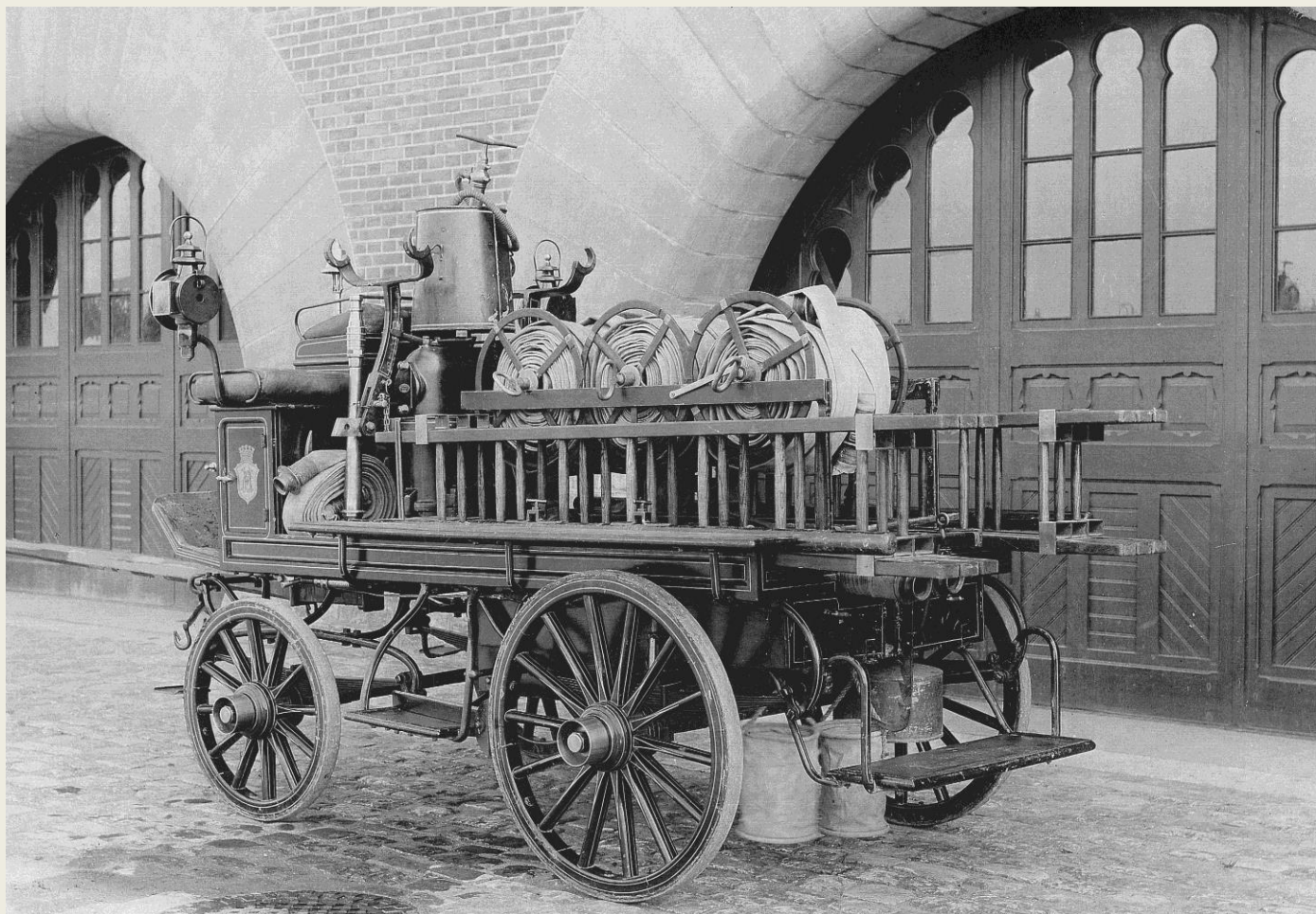
Bilden ovan är sannolikt tagen omkring 1900 utanför stora redskapshuset, några år efter brandstationens invigning 1 april 1894.