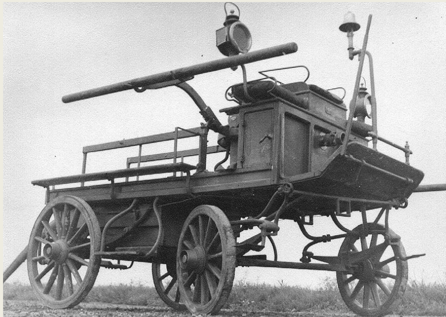
Bilden visar sprutan avrustad, sannolikt innan den ställdes i museets förvaring.