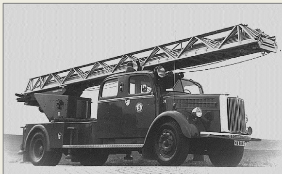
Efter en kollision byttes maskinstegen ut mot en hydrauldriven DG230 omkring 1960.