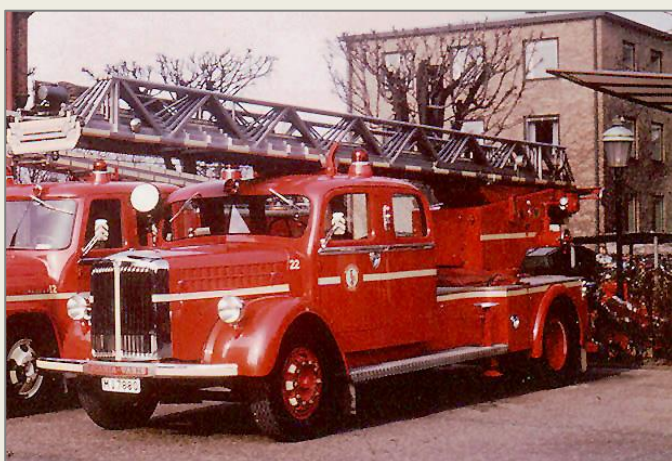
M17880, bil 22, försedd med vita reflekterande band 1969. Vargtjuttssirénen är ersatt av kompressorsirén.