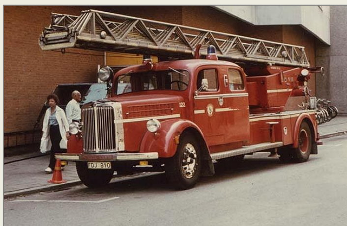
FDJ810, bil 122, försedd med blåa utryckningsljus 1978.