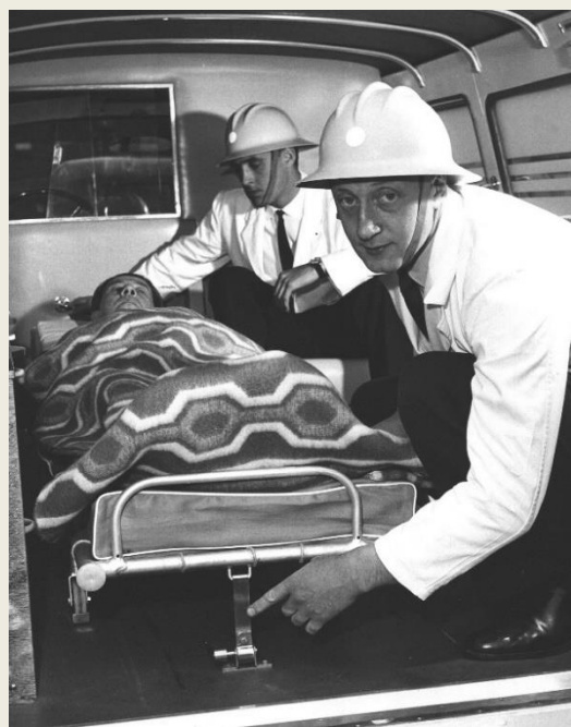
Nyheter: Lös handlykta, spärranordning för bären, röd skiva att montera på den bakåtriktade arbetslyktan.