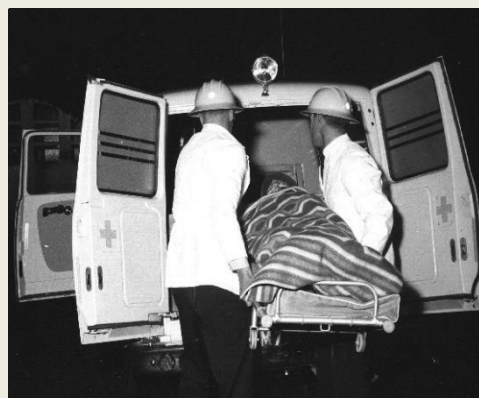
Mörkerfotografering med fast belysning ger otrevliga reflexer i kromade detaljer. Därför har dessa detaljer tillfälligt målats i svart färg inför fotograferingen. Dock inte registreringsskylten!