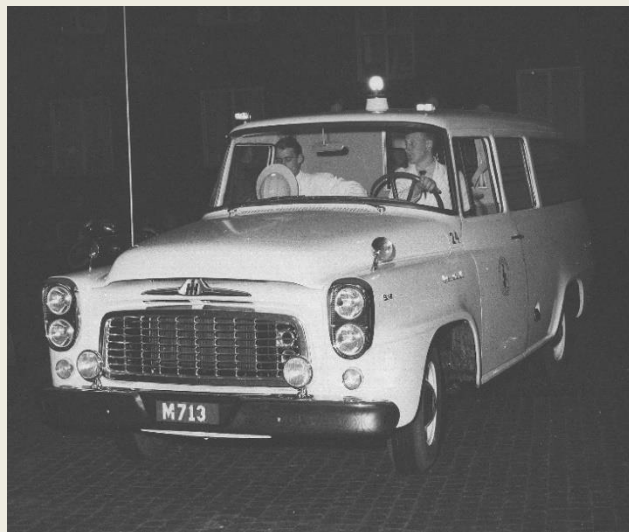
Nyheter: Skyddshjälmor för personalen, säkerhetsbälten för personal och för sittande i vårdhytten. M713 = MA20571.