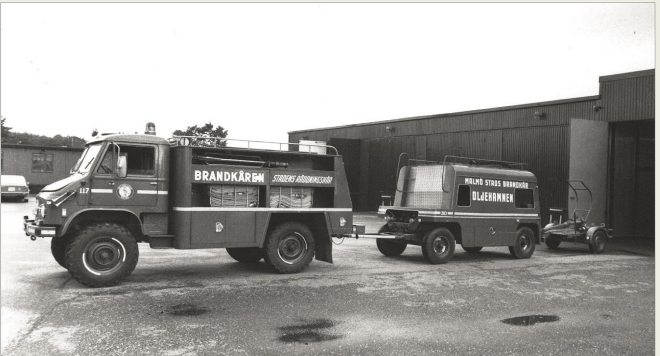
Nedan. Bil 117 med skumvätskevagn nr 203 och mobil skum-/vattenkanon nr 205 utanför garaget på station Bulltofta.