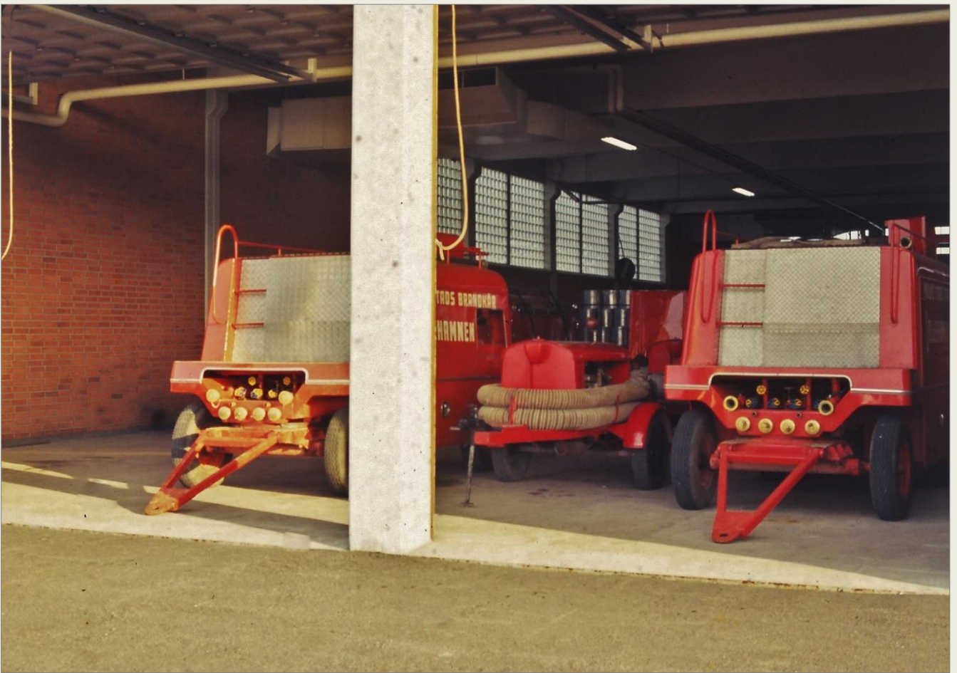
Ovan. Skumvätskevagn 203 t.v. och 202 i garaget hos Tobaksbolaget. Här ser man tydligt skillnaderna mot den första vagnen på bilderna ovan. Dragstängerna och aluminiumdurken är några exempel.