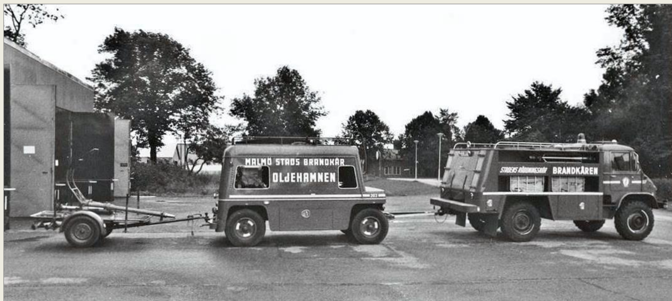
Bil 117 med skumvätskevagn nr 203 och mobil skum-/vattenkanon nr 205 utanför garaget på station Bulltofta.