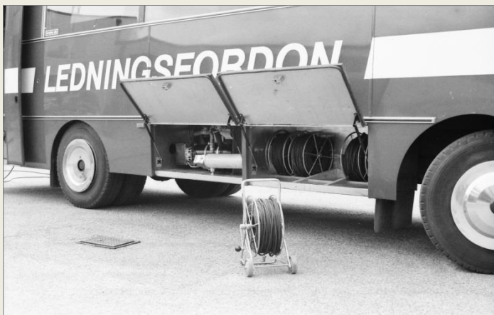
Förråd av elkabel på vindor.

Bilden till vänster. Telekommunikationscentralen. Härifrån kunde man koppla in sig på enskild abonnents ledning genom lagstörd rekvisition.