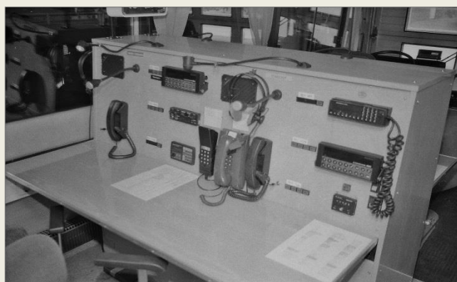
Räddningstjänsten till vänster och stabschefen till höger.

Bilderna är från 1990 och larmborden ser säkert annorlunda ut 2015 med ny kommunikationsteknik etc.