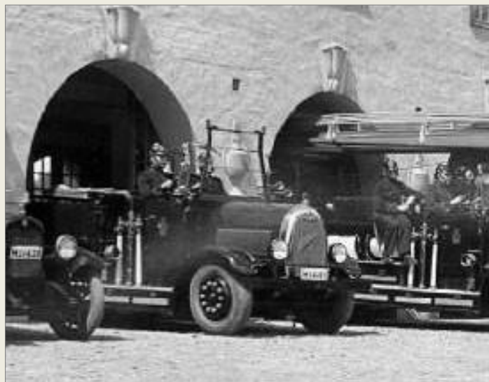
M14683. Bilen var identisk till utförandet med M14682 men saknade avbröstbar stege.