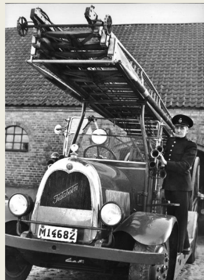
M14682. Okänd man.