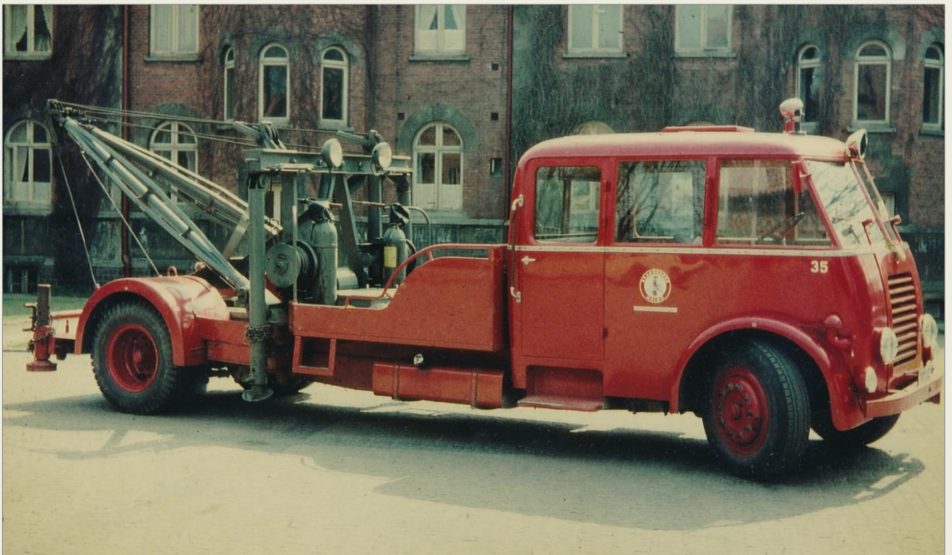
Bärningsaggregat typ Holmes/Tranås.