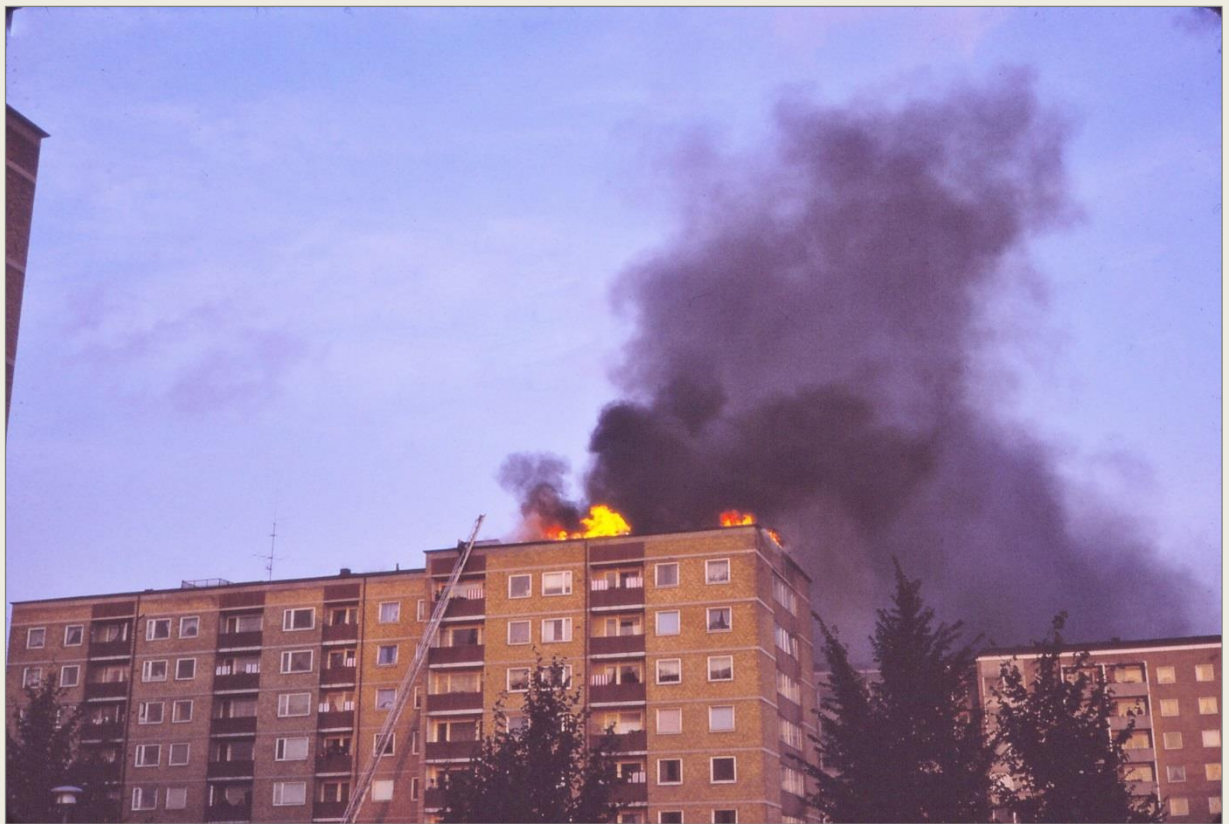
1972 brinner det också i de olika bostadsområden i stadens ytterområden. Här på Nydala utvecklas en kraftig vindsbrand medan andra pågår i Kroksbäck.