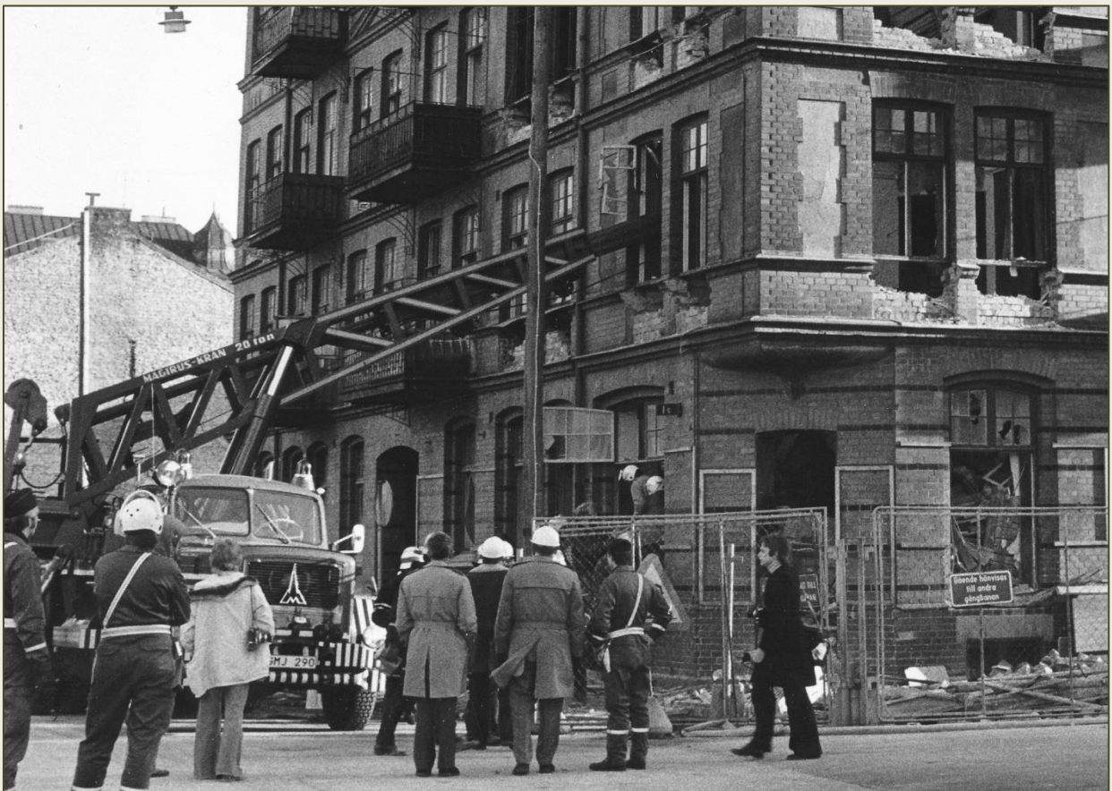
1973, den 4 december rasar bjälklag inne i ett rivningshus i hörnet Smedjegatan – Nicolaigatan. Några rivningsarbetare blir inestängda och bjälklaget hotar att rasa ytterligare. Med brandkårens kranbil lyckas man hålla bjälklaget på plats tills arbetarna kunnat räddas ut ur rasmassorna.