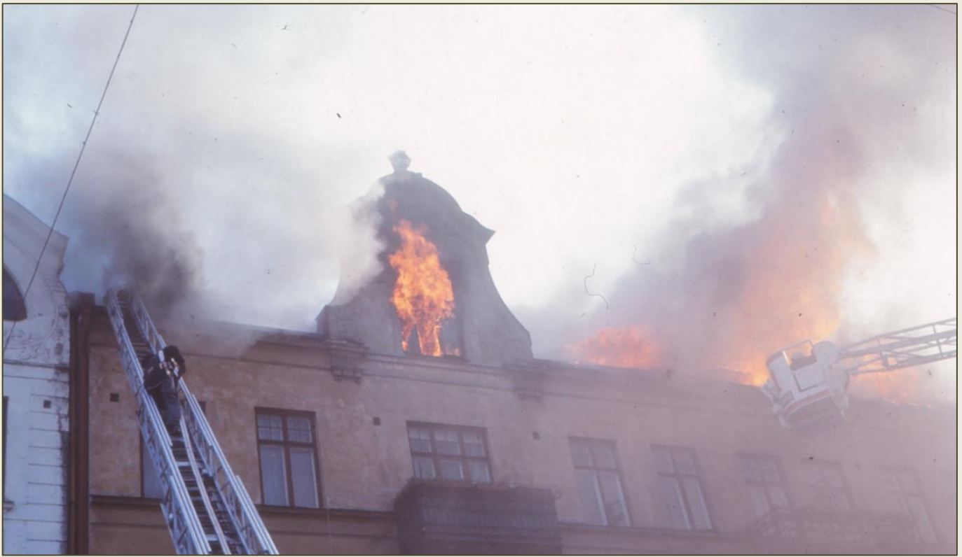
I augusti 1972 brinner denna byggnad på Spångatan 31 sex gånger. Stegbil 122 och hävare 124 i aktion.