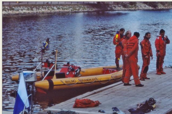
Räddningsbåten Veedo 20. Radio nr 169. Transporterades på trailer nr 334.