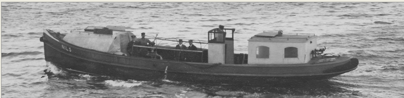
Sjöångsprutan NILS. Bilden daterad till 1922.