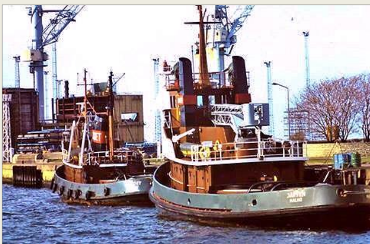
Bogserbåtarna SUNDET och JÄRVEN i ursprungliga färgsättningen. Nedan JÄRVEN.