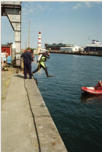
Räddningsbåten från vattendykarbilen 32107.