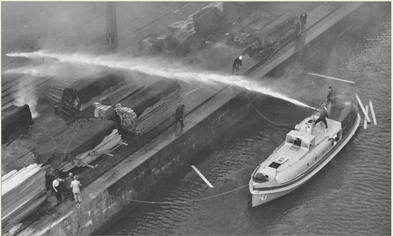
Sjöängsprutan NILS i aktion vid brand i träupplag i hamnen. Båten har fått ny färgsättning och moderniserad styrhytt. Färg okänd.