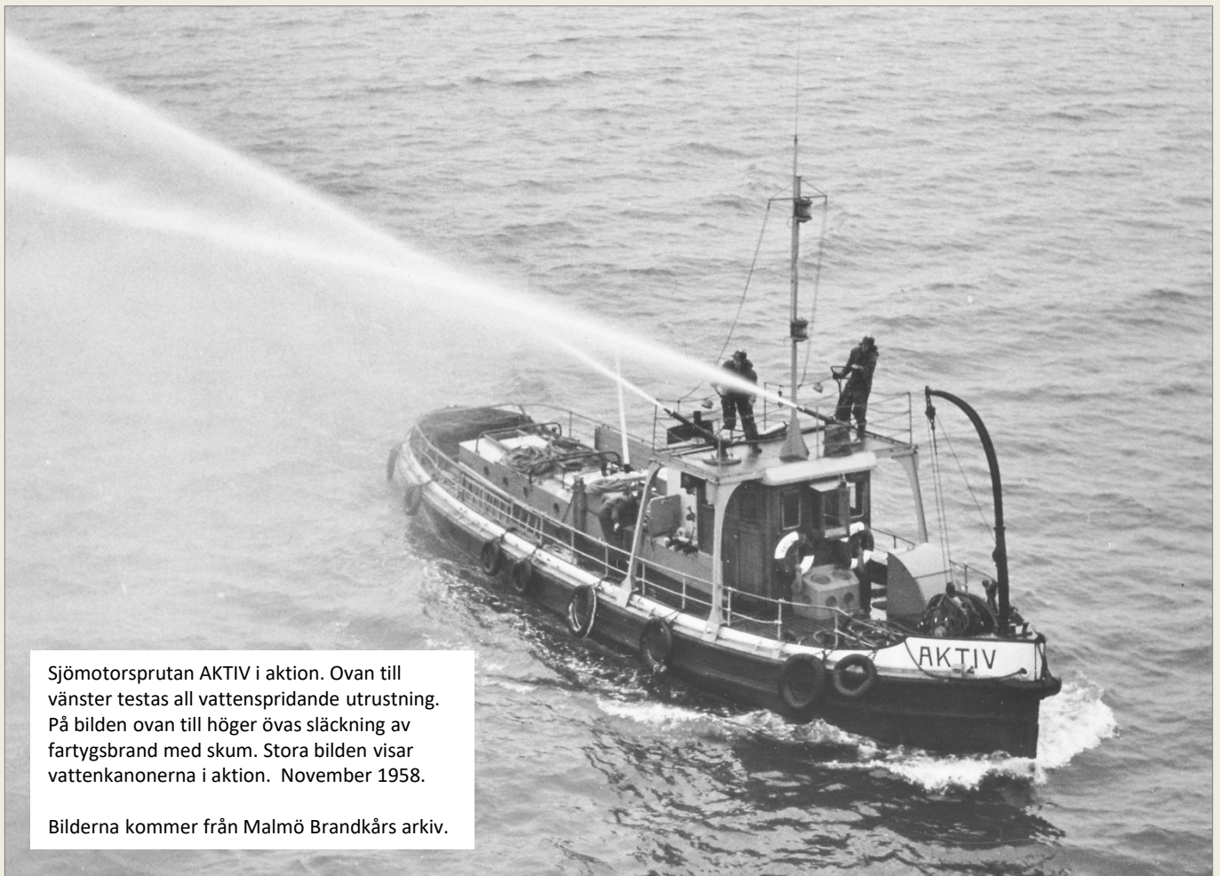
Sjömotorsprutan AKTIV i aktion. Ovan till vänster testas all vattenspridande utrustning. På bilden ovan till höger övas släckning av fartygsbrand med skum. Stora bilden visar vattenkanonerna i aktion. November 1958.