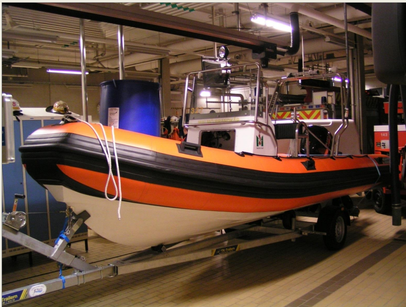
Räddningsbåten 32169, från 2010 Rakel-nr 261-1199, finns på Hyllie brandstation sedan 2005.