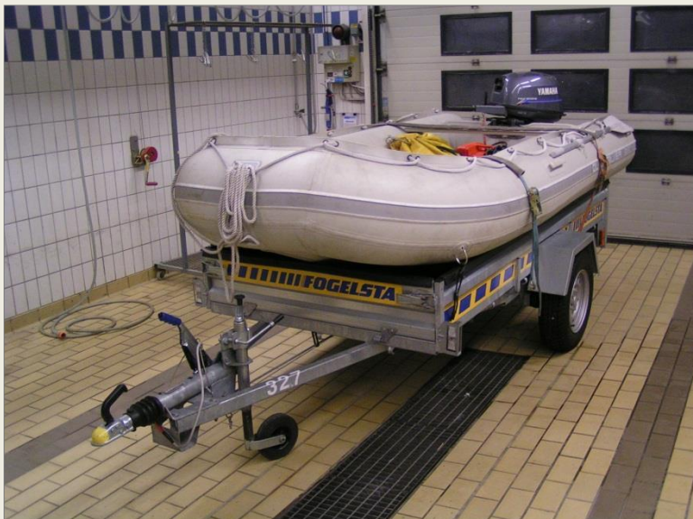
Länsbåten på trailer 327.